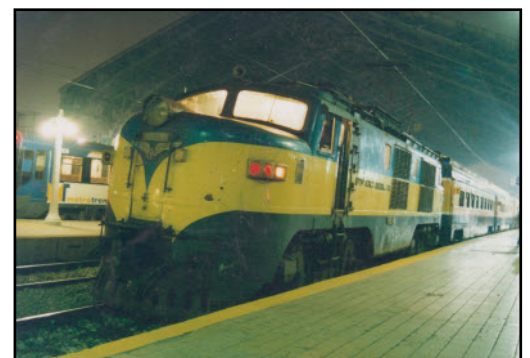
Última salida del Rápido del Bio-Bío N°1019, Andén 6, Estación Central. 2005.